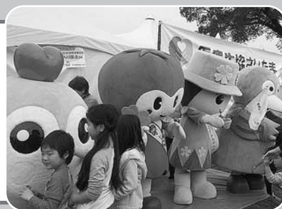
ウォークフェスタ2016 ゆるキャラ集合