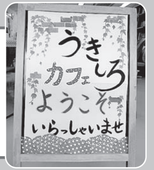
「うきしろカフェ」の看板です