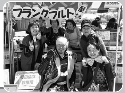
2017ウオークフェスタ模擬店