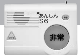
お手元にあんしんコール

息子さんと2人暮らしのMさん、要介護4ですい臓がんの治療を終え退院、ベット上での生活ですが、お食事はご自分で食べられます。息子さんもお仕事があり、日中はお一人で過ごされます。息子さんの不在時の緊急対応が不安とのことでした。