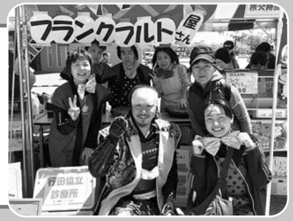
2017ウオークフェスタ模擬店