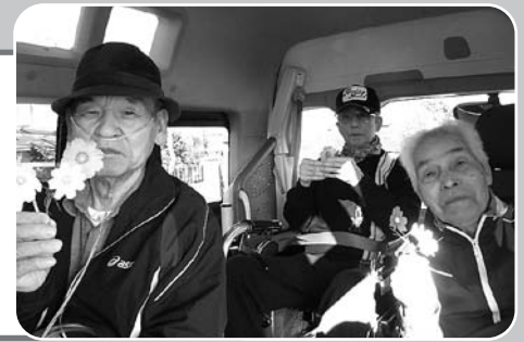
台風去ってコスモス見学の男性陣