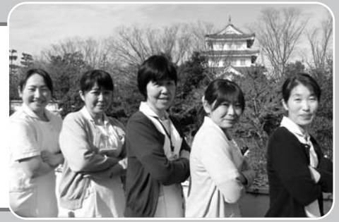
外来看護師のそらい踏みです