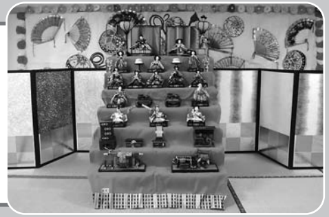
お離さま出しました!