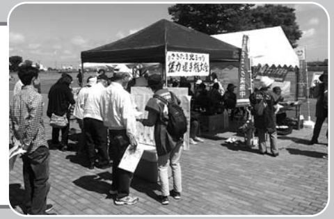
さきたま火まつり健康チェック