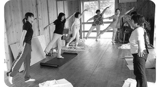
利根支部健康体操

ご存知の通り、医療生協は組合員と職員と一緒に健康で安心して暮らせるまちづくりを目指して活動に取り組んでいます。皆様のお手元にわたる機関紙などの配布活動をはじめ、組合員による健康づくりや健康チェック