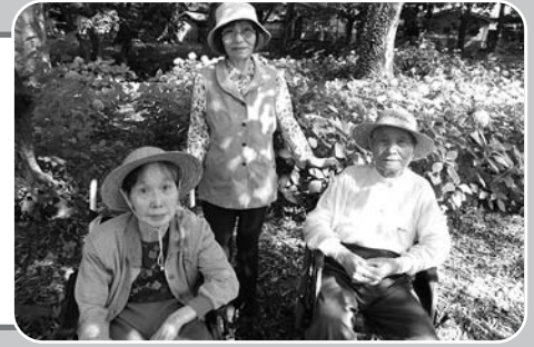
水城公園あじさい見学