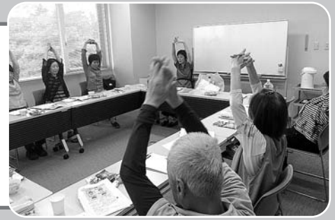
加須支部 安心ルーム