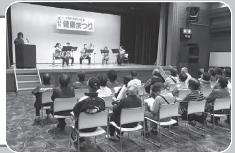
行田市吹奏楽団の演奏で開会