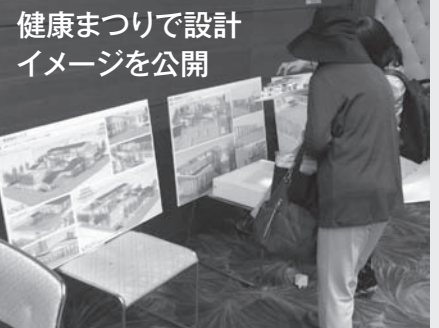
健康まつりで設計イメージを公開

そこで、診療所を2020年4月までにリニューアル(改築)することになりました。設計会社の選定も終え、みなさまの意見を頂戴しながら新しい事業所の建設にむけて動き出しております。事業所の開設には多額の資金を必要とします。非営利の生協法人にあつては、自己資金である出資金の確保が建設にあたっては不可欠です。ぜひ、この機会に出資金の増額にご協力を頂きますようお願い申し上げます。