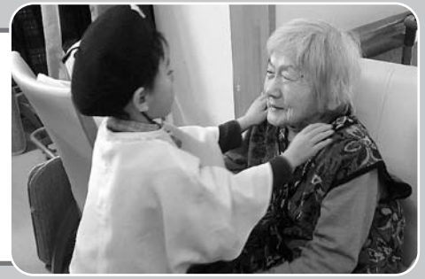
うきしろにホザナの子どもたち