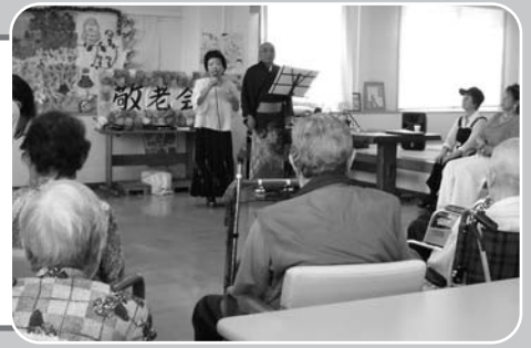
うきしろでは演芸会を楽しみました