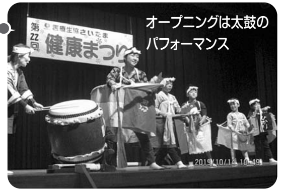
オープニングは太鼓のパフォーマンス

多くの皆様のご協力で成功できましたことを、この場をお借りしてお礼申し上げます。また、こうしたつながりへの参加そのものが健康づくりの大切な取り組みとして、来年も位置づけていきたいと思っております。