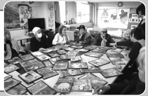
うきしろ新春カルタ大会は真剣そのもの