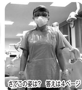
さてこの姿は? 答えは4ページ

医療生協さいたま生活協同組合 行田市本丸18-3 行田協立診療所 内科・歯科・在宅医療 048-556-4581 短時間通所リハビリテーションたびくら 048-501-8740 ケアセンターさきたま (居宅介護支援・訪問介護・訪問看護・小規模多機能ホーム) 048-556-4612