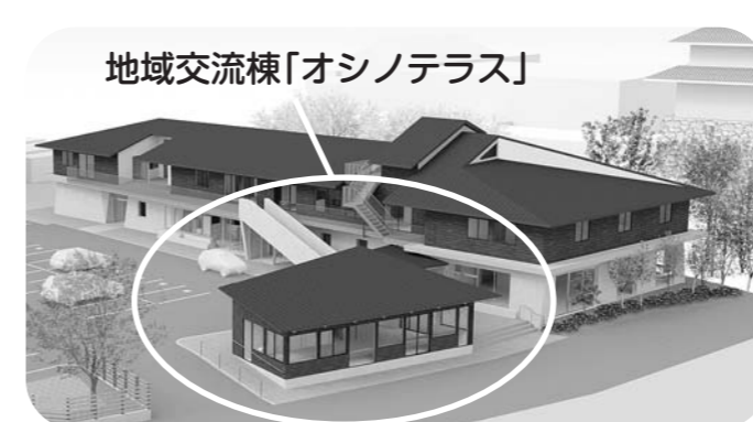
地域交流棟「オシノテラス」