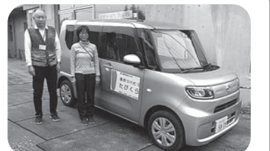
通所リハビリの送迎車新調しました

ケアセンターさきたま (居宅介護支援・訪問介護・訪問看護・小規模多機能ホーム) 048-556-4612