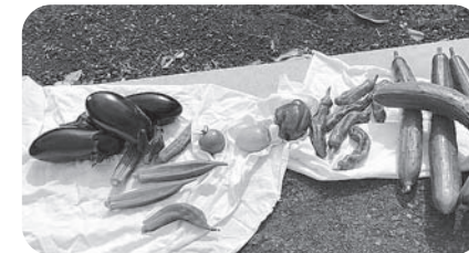
立派な夏野菜を収穫しました

2021年 (http://www.gyouda-clinic.coop/) 工事中